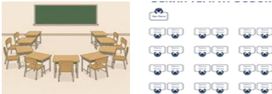
Gambar 4. Pengaturan Tempat Duduk yang Ideal

Temuan di lapangan menunjukkan adanya variasi kemampuan siswa dalam memahami materi Bahasa Arab. Sebagian siswa mampu memahami dengan cepat, sementara yang lain membutuhkan waktu lebih lama. Selain itu, keterbatasan fasilitas seperti tidak tersedianya LCD, proyektor, dan media pendukung lainnya mempengaruhi proses pembelajaran. Guru mengatasi hal ini dengan menggunakan metode manual, seperti menulis di papan tulis dan membuat dialog secara langsung. Gangguan eksternal seperti kebisingan juga ditemukan mempengaruhi konsentrasi siswa. Di sisi lain, faktor pendukung terlihat dari kesiapan guru dalam mengajar serta keterlibatan aktif siswa dalam pembelajaran. Lingkungan kelas yang diatur dengan baik juga membantu menciptakan suasana belajar yang kondusif. Temuan ini menunjukkan bahwa faktor penghambat dan pendukung hadir secara bersamaan dalam proses pembelajaran.